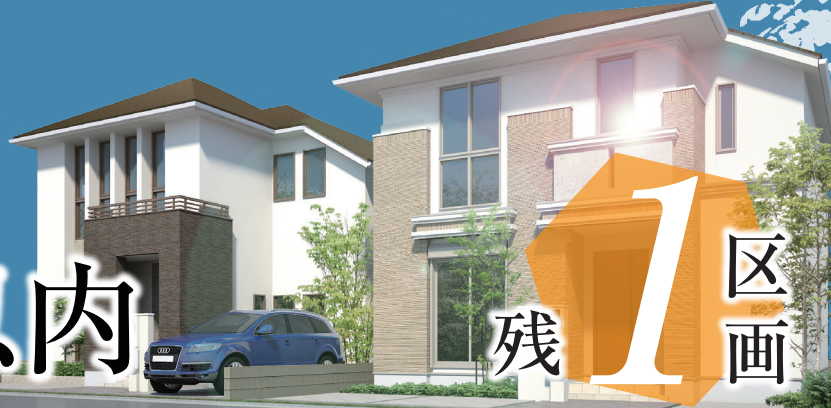
※イメージCG画像(実際とは異なります)