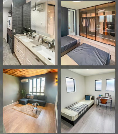
※当社モデルハウス写真

自由設計だからこそできる、 ご家族様の生活スタイルや 好みに合わせたこだわりの プランをご提案致します。