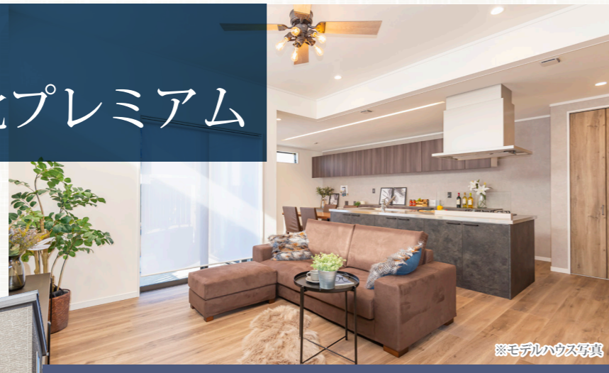
※モデルハウス写真

Smile Town JR Tarumekikita Premium スマイルタウン JR 垂水駅北プレミアム