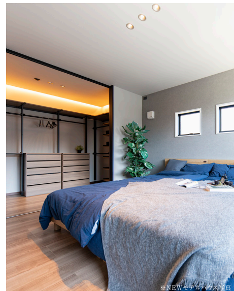
※NEWモデルハウス写真