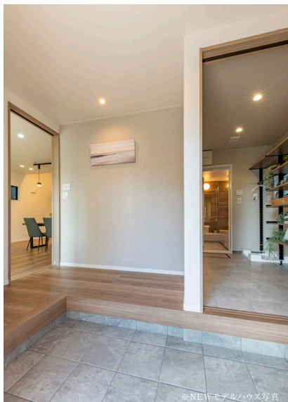
※NEWモデルハウス写真