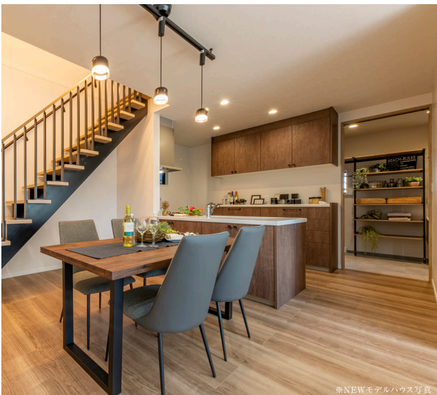
※NEWモデルハウス写真