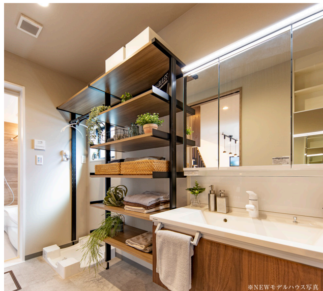
※NEWモデルハウス写真