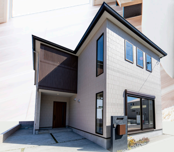
NEW MODEL HOUSE