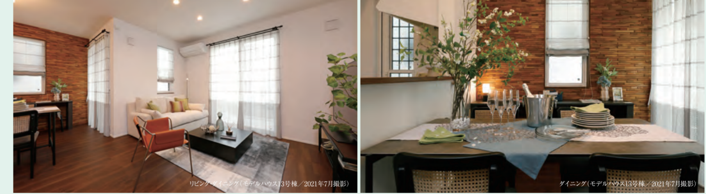
※掲載の家具・家電・備品等は価格に含まれません。 ※モデルハウス13号棟は今回販売対象戸ではありませんが、規模・仕様・形状等が同一のものとなります。