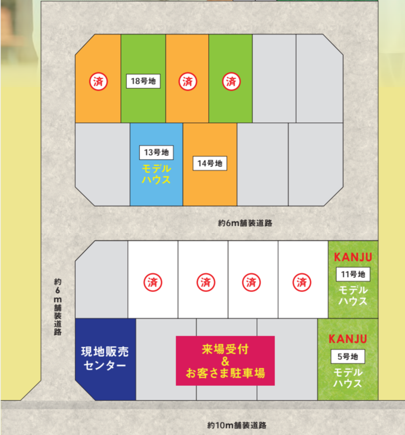
※販売状況は2023年4月13日現在のものです。 ※全体区画イメージ図は、図面を基に描き起こしたもので、実際とは多少異なります。 全体区画イメージ図