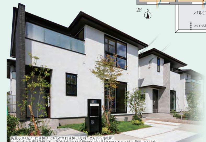
前号写真(左より)12号棟、モデルハウス13号棟、14号棟。2021年9月撮影 ※12号棟は次期以降販売予定となります ※13号棟は2021年8月1日モデルハウスとして使用しています。