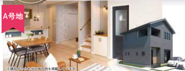
※建設中のため当社施工例を掲載しています。