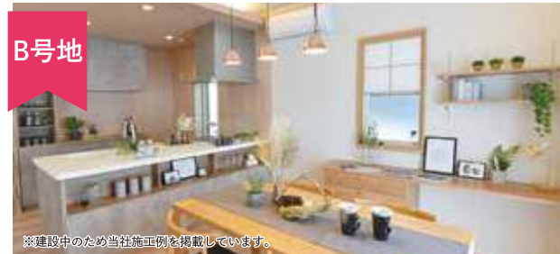
※建設中のため当社施工例を掲載しています。