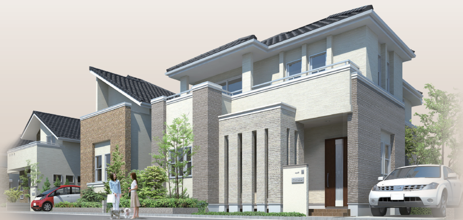
※街並み完成イメージCG