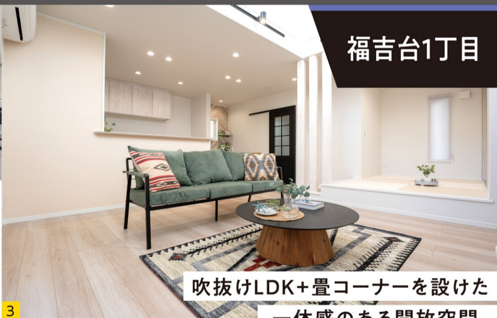
吹抜けLDK+畳コーナーを設けた 一体感のある開放空間。