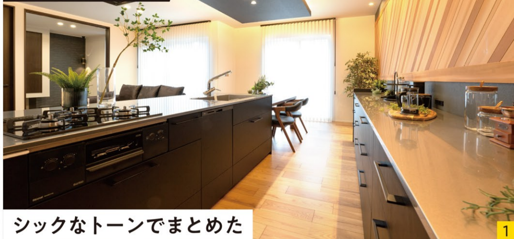
シックなトーンでまとめた 重厚感漂うLDK。