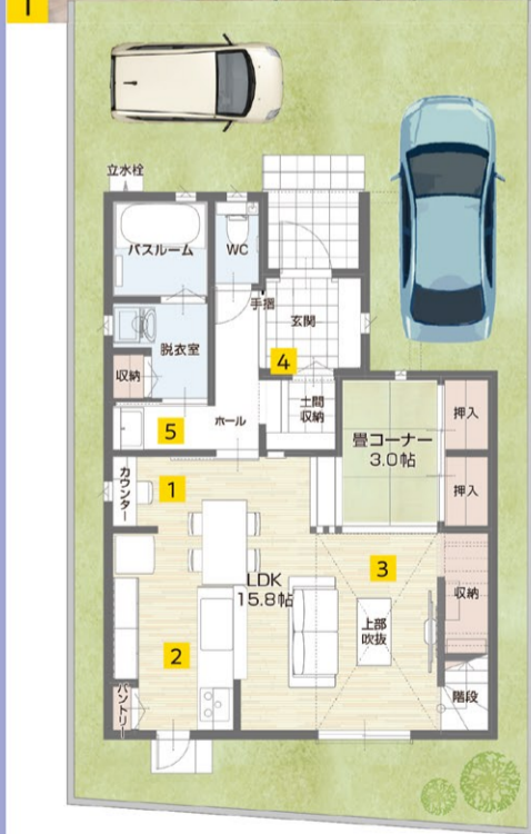
4 収納扉を開けるだけでベビーカーやアウトドア用品をそのままスムーズに出し入れできる玄関の隣に設置した土間収納は、玄関からもホールからも出入り可能です。