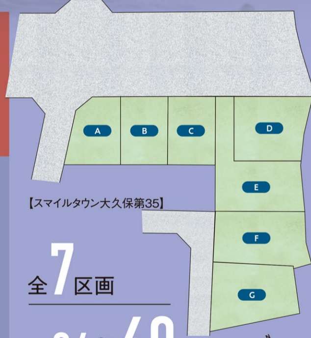
【スマイルタウン大久保第35】