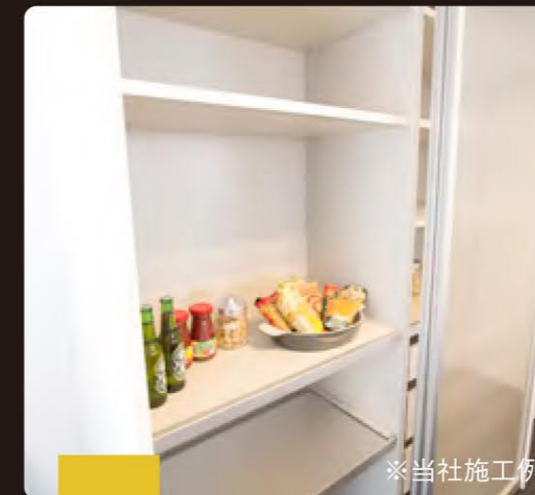
POINT 02 STORAGE 多収納設計

カーペットの敷かれた小上がりの空間は、立体感のある落ち着いた空間。天井高を低くし「こもり感」を演出。備え付けの棚もあり寛ぎのひと時を過ごせます。小さなお子様の遊び場所や赤ちゃんのお昼寝スペースとしても大活躍。