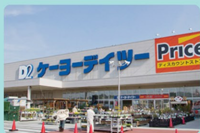
ケーヨーデイツー