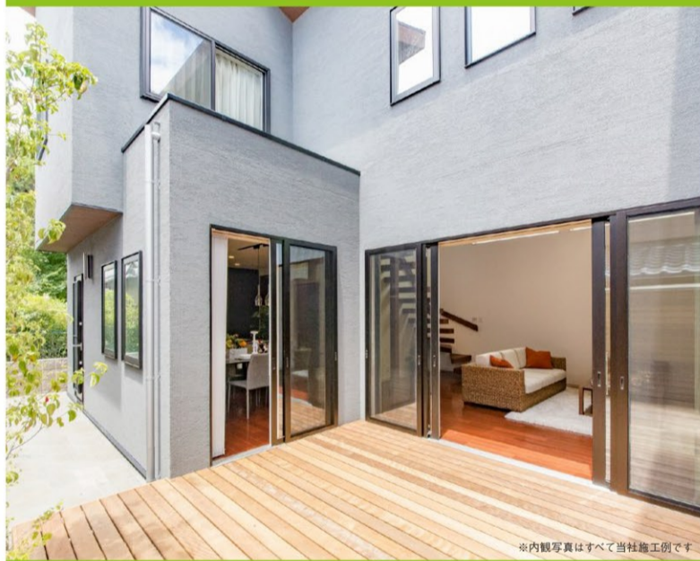
※内観写真はすべて当社施工例です