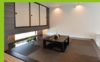
床暖房付きの寛ぎ和室

広々としたゆとりあるリビングの南面に設けられたウッドデッキスペースは、外からの視線が気にならない堀で囲まれた屋外のプライベート空間。アウトドアリビングや、お子様の遊び場として活躍するおうち時間を満喫するスペースに。晴れた日にはお友達を呼んでBBQを楽しむことも！