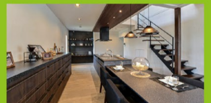
開放的なキッチン&ダイニング