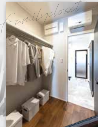
玄関、洗面とつながるファミリークローゼット