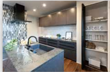
美しさを備えながら、使いやすさにこだわった最上位モデルのフラットキッチン。(リシェルスI)