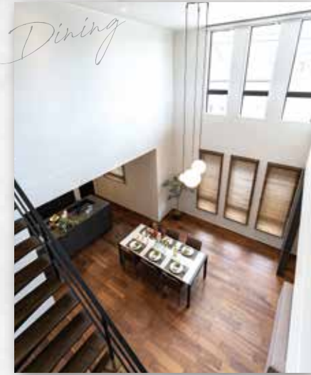
大きな吹き抜けが開放的