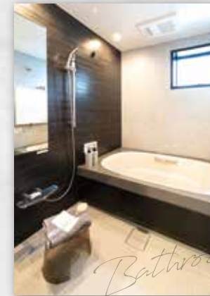
質感高い仕様(スパーージュ)毎日のバスタイムをより豊かに心地よく過ごすことができます。