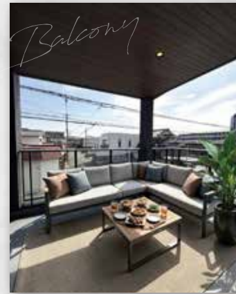
開放的なバルコニー。テーブルセットを配置して、のんびりカフェタイムも♪