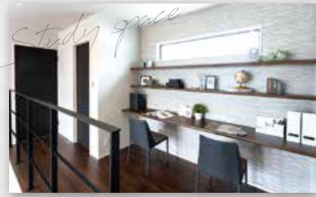
リモートワークも可能な2階ホールの書斎スペース。