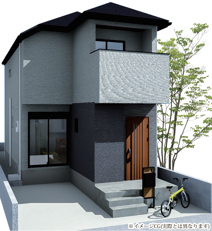
※イメージCG(実際とは異なります)

モデルハウス見学予約受付中 見学をご希望の方は下記電話または、QRコードよりお電話・お問い合わせ下さい